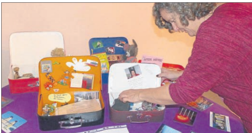
Individuell bestückte Erinnerungskoffer sind Teil der Trauerbewältigung.