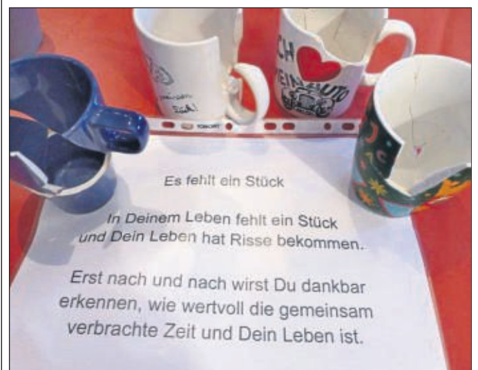
Plötzlich zerbrochene Gegenstände des alltäglichen Gebrauchs und dazu passende Worte regten zum Nachdenken an.