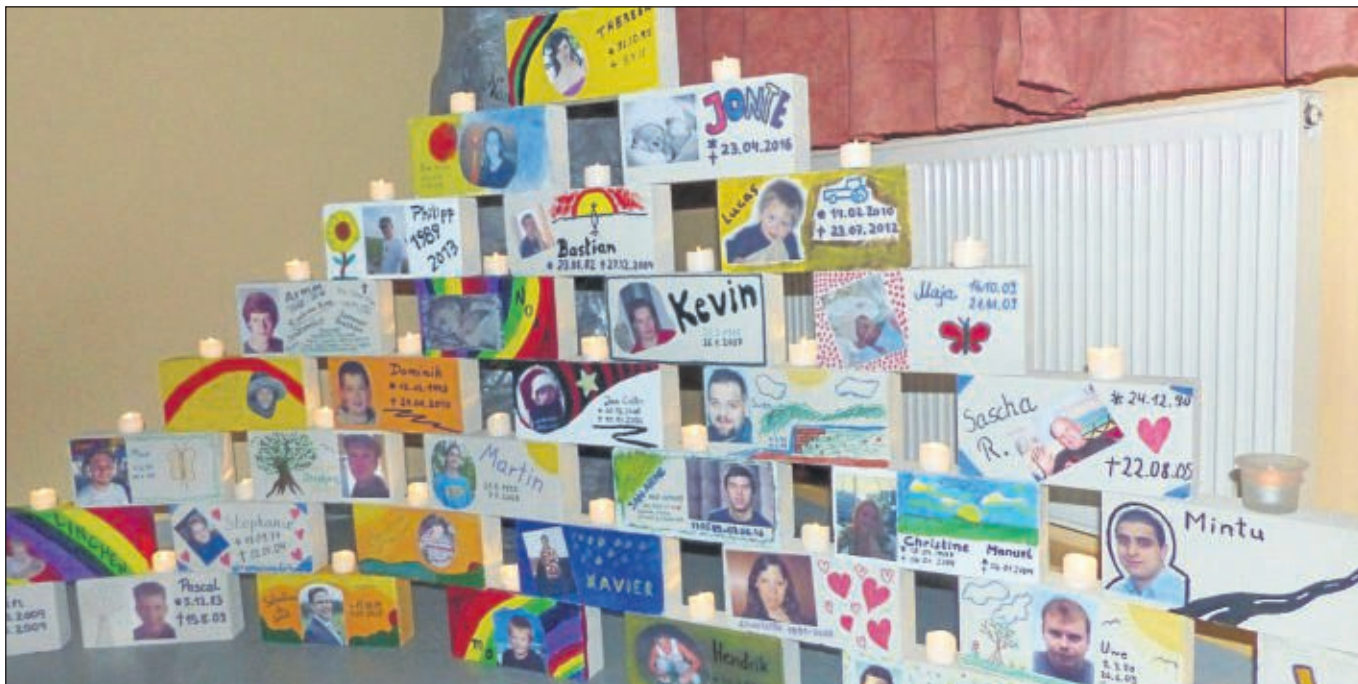
Eine aus 40 Steinen bestehende Gedenkmauer mit den Namen des jeweils verstorbenen Kindes erinnerte im Lutherhaus an 40 verschiedene Einzelschicksale.